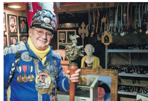
'T LESTOGENBLIK – CARNAVAL IN 'T GINNEKEN CURATOR KOEN MELIS HOE HET BEGON:

Is een echte aanrader. Geopend op woensdag tot en met vrijdag van 13u00 tot 17u00 en op zaterdag van 10u00 tot 12u00.